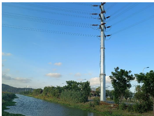
线路跨越百里大河走线现状