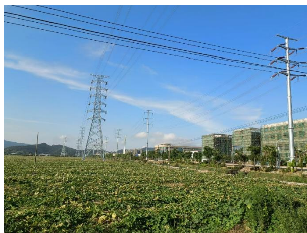
线路沿耕地走线现状