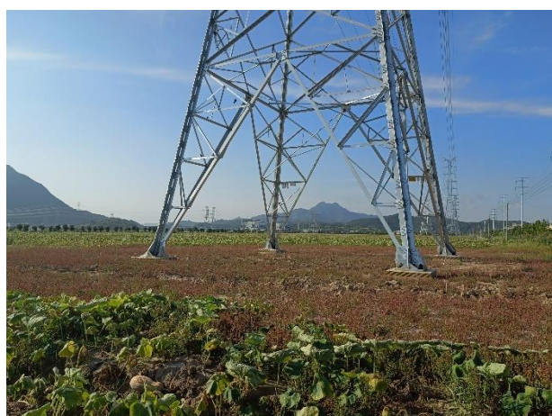
珊童 1549 线/珊化 1553 线 5 号塔基绿化